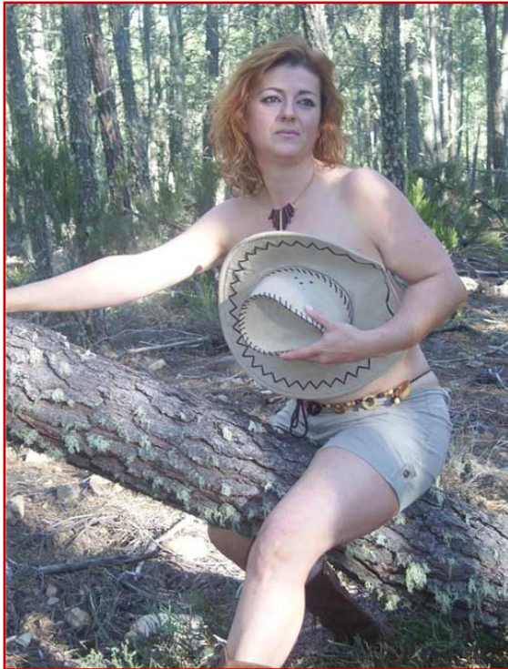
Homenaje a las madres

La aventura del calendario erótico no tuvo la repercusión económica esperada. A finales de 2007 los medios de comunicación se hicieron eco de un curiosa noticia. Un grupo de madres de Serradilla del Arroyo (Salamanca) habían posado para un calendario erótico con el fin de recaudar fondos para la construcción de un local de ocio para sus hijos.