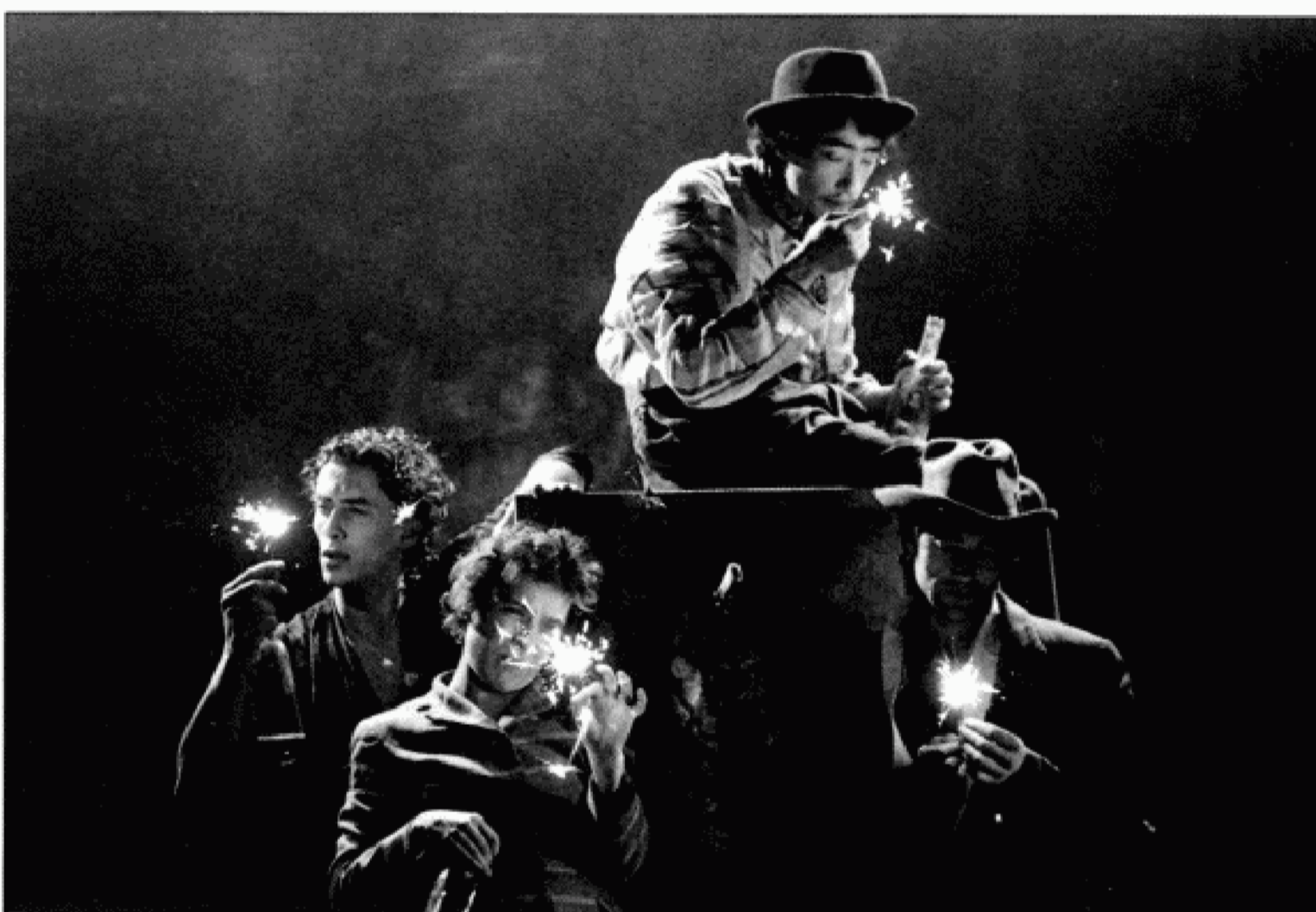
Imágenes hirientes, de una violencia directa, conforman el último montaje de Bekereke.