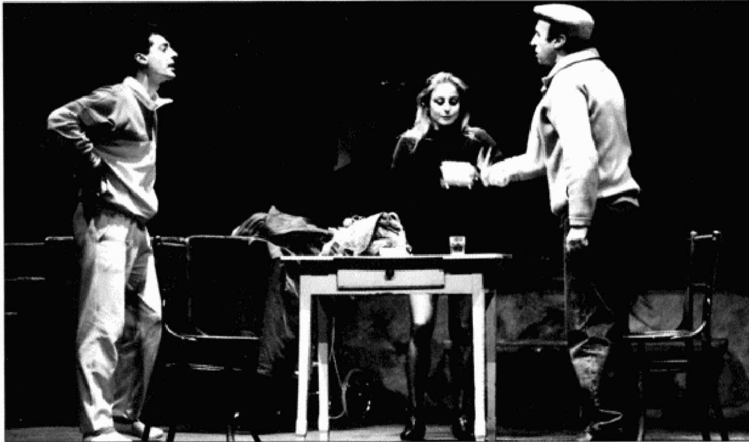
Realismo sin matices naturalistas. Tres personajes discurren por la vida en los márgenes de sentimientos y frustraciones.