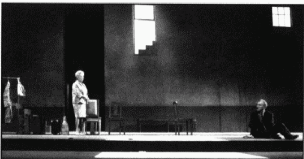
Un ballet fascinante entre la risa y el pavor.