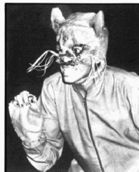
"Una medalla para las conejitas" (arriba) y "El hechizo del león".

De ningún modo estas cambiantes características impiden que estas agrupaciones cumplan una función fundamental en la búsqueda y desarrollo de un arte dramático con voz propia. Como hecho se produce la antítesis; porque necesariamente comien-