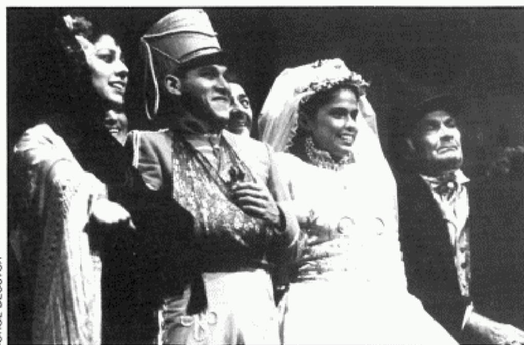
La obra de Rodríguez Méndez, representada por el grupo peruano Ensayo.

El diseño del montaje se permite algunas distancias con el original de Rodríguez Méndez. Estas distancias no sólo son literarias, sino también brechtianas, al insertar un presentador entre las escenas o estampas. Este recurso se amplifica aún más con las rondas infantiles recopiladas