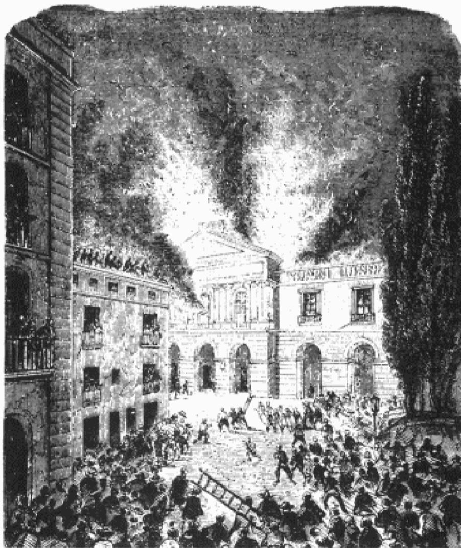
El incendio de 1858, según un grabado de Julio Virenque. A la derecha, fachada del teatro, lo único que se salvó de la quema.

Es la reforma —tal vez la última— que queda pendiente para que el Teatre Principal, una coqueta y bellísima bombonera, se ponga en línea con las actuales necesidades del espectáculo. ■