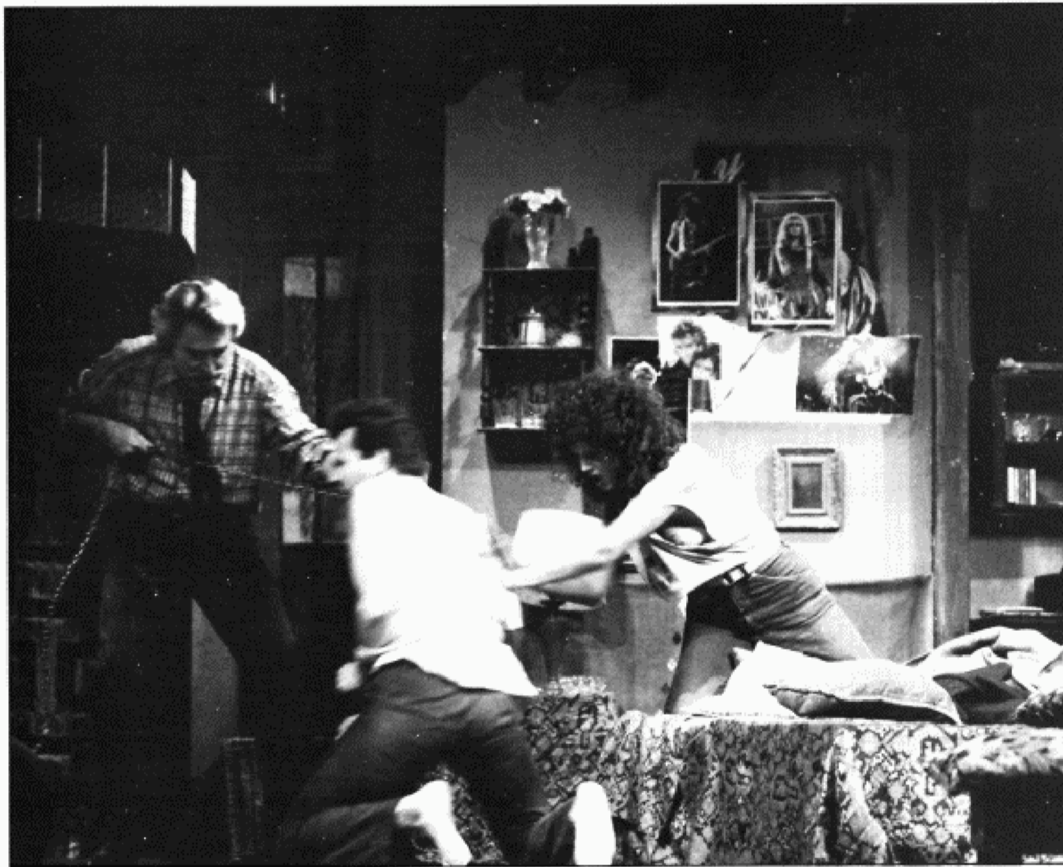
Lenguaje realista sin asomos para el humor.

en la espantosa "civilización" que nos ha deparado los grandes poderes temporales. En muchas ciudades del mundo existen hoy infiernos como los que se describen en este drama".