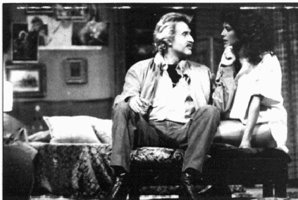
La droga es sólo un elemento de la degradación.

El marco del "infierno" que La marca del fuego presenta al espectador no es otro que una buhardilla de Lavapiés, con sus vigas de madera carcomida, viejos baúles y puertas desvencijadas. Aquí trata de rehabilitar su vida una pareja. Esta pareja tiene una niña de meses que de vez en cuando corta con su comparecencia sonora las discusiones de sus padres. El padre acaba de salir de la cárcel. Su intento de rehabilitación no cuadra precisamente con la paliza que acaba de dar a una vieja que se resistía a