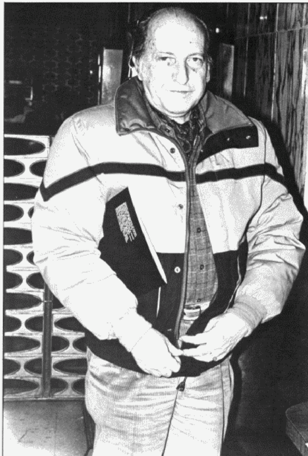
El autor sigue acariciando proyectos.

Y apuró el último trago de su bitter-Kas.