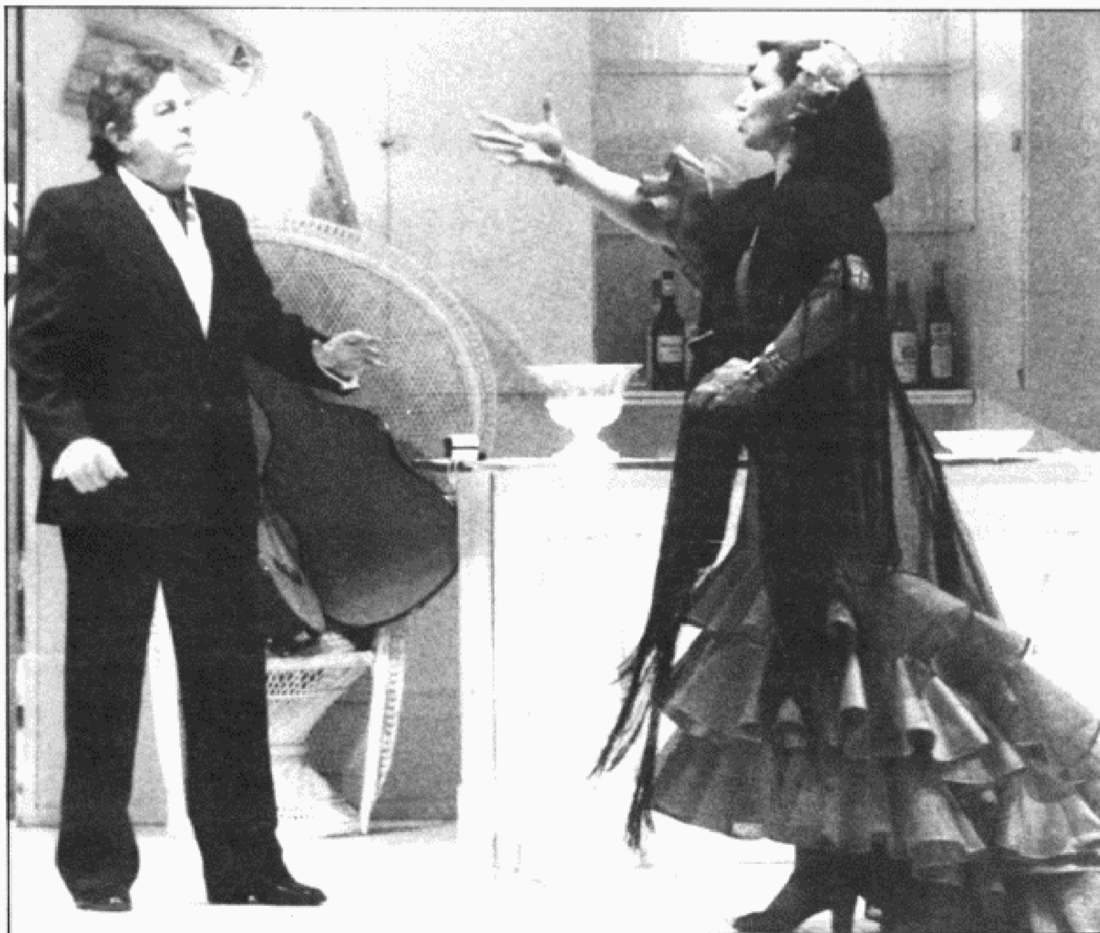
Iberismo y testimonio.

algo positivo... y el morirse sigue siendo un problema muy difícil. Eso es lo que yo veo. Lo demás son matices para eruditos".