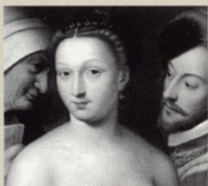
Imagen: Carta de amor de Jean Clouet