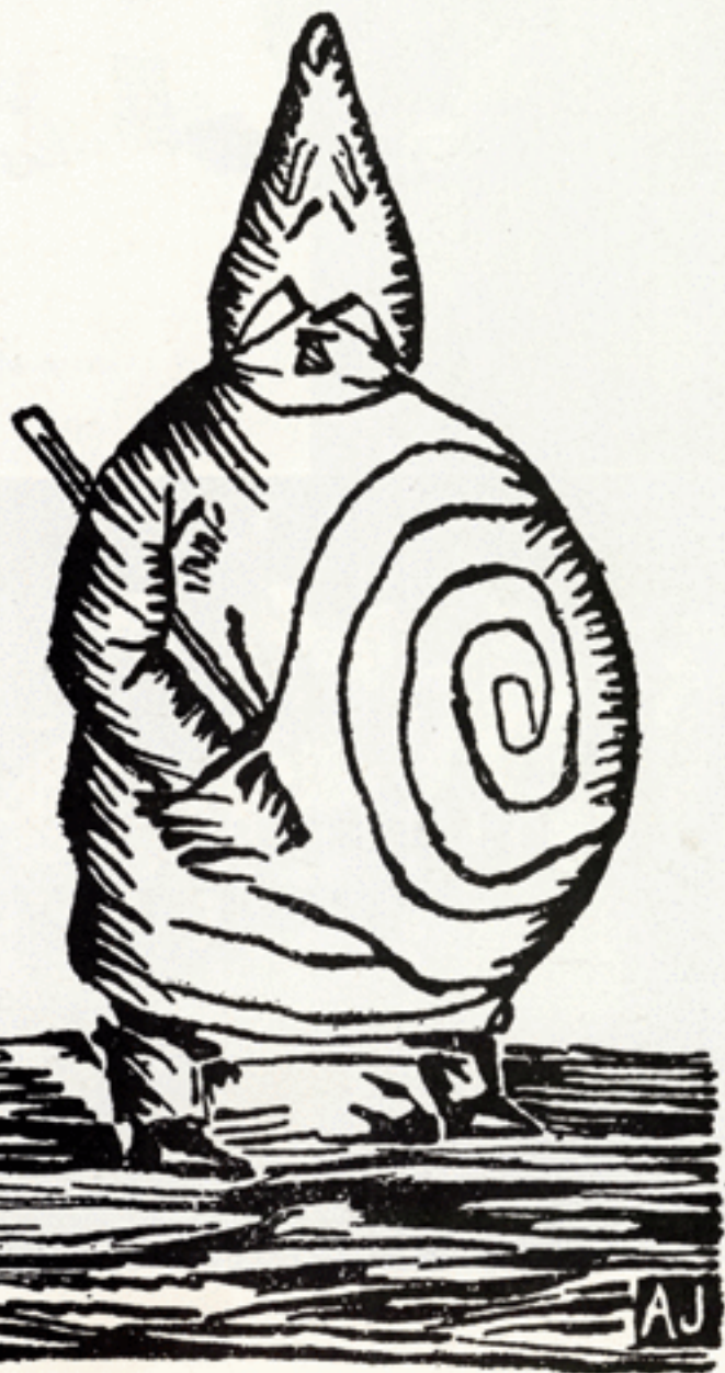
Bocetos de Alfred Jarry del personaje de Ubú.