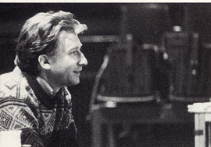
Albert Boadella dirigiendo un ensayo de Operació Ubú en 1981