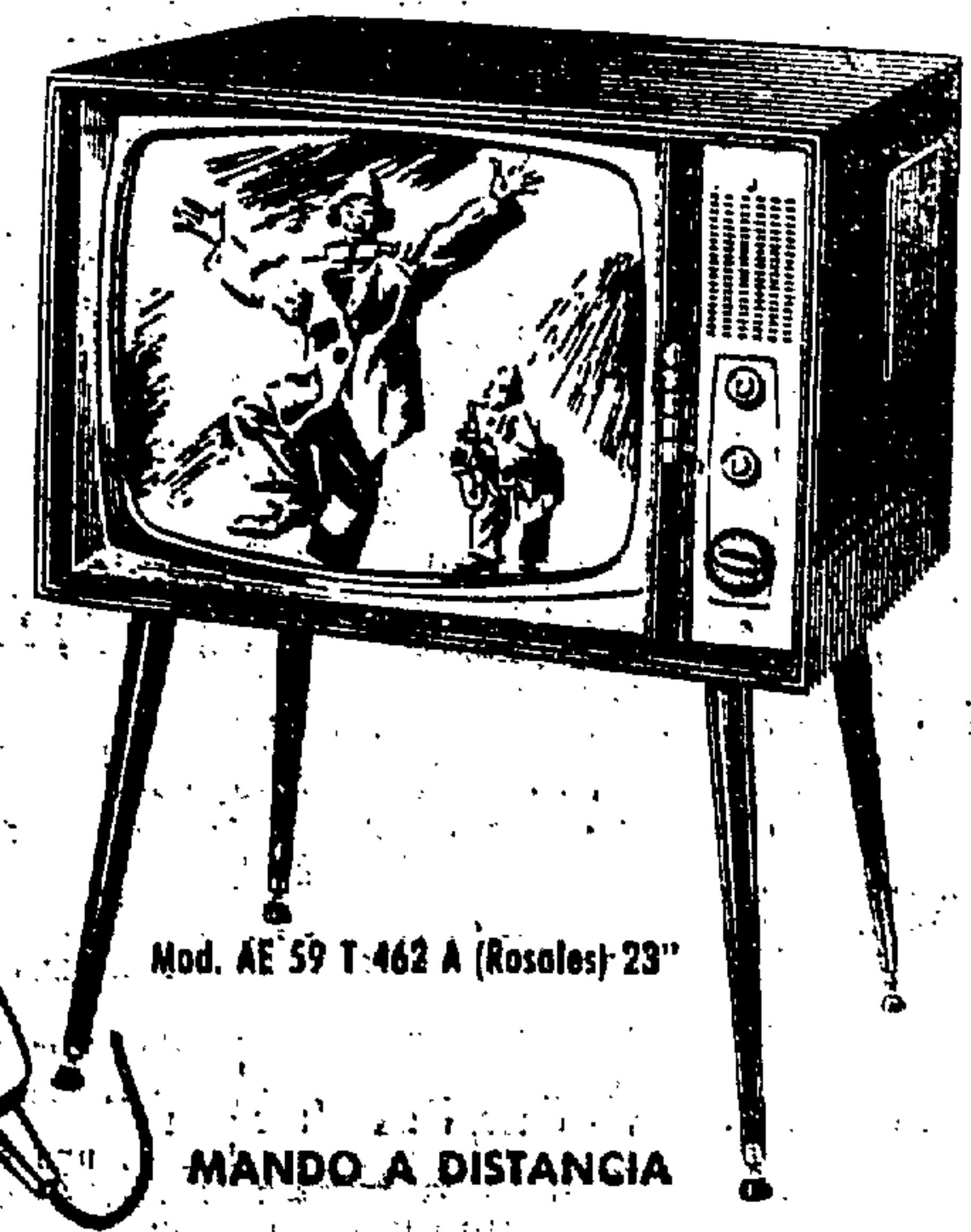
Mod. AE 59 T 462 A (Rosales) 23"

FRECUENCIA MODULADA • ASKAR • RADIO-GRAMOLAS • ASKAR • TRANSISTORES • ASKAR • TELEVISORES