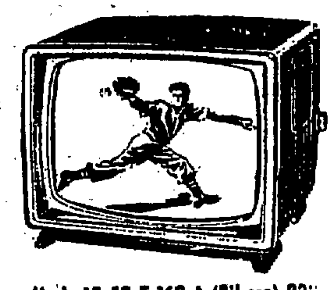
Mod. AE 59 T 162 A (Ribera) 23"