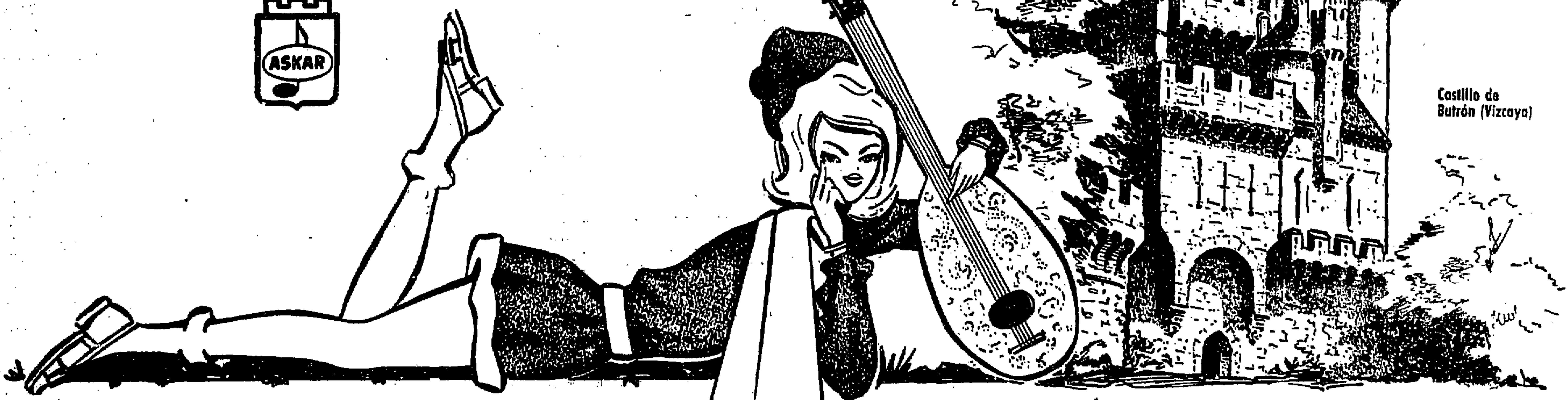
Castillo de Butrón (Vizcaya)