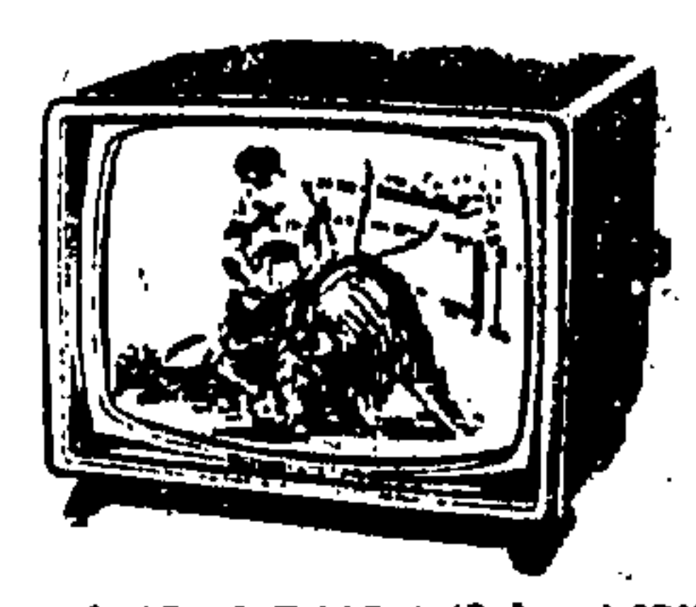
Mod. AE 48 T 162 A (Solana) 19"