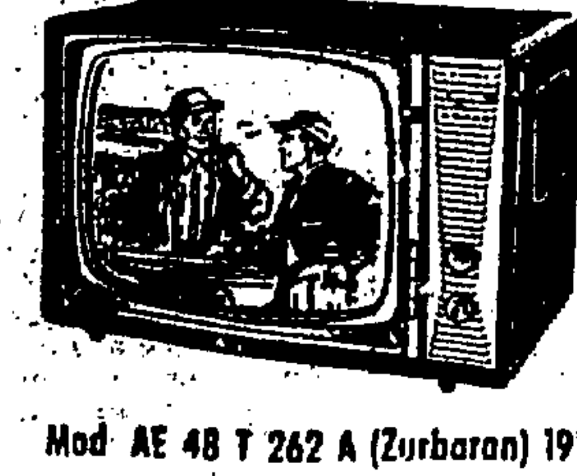
Mod. AE 48 T 262 A (Zurbarán) 19"