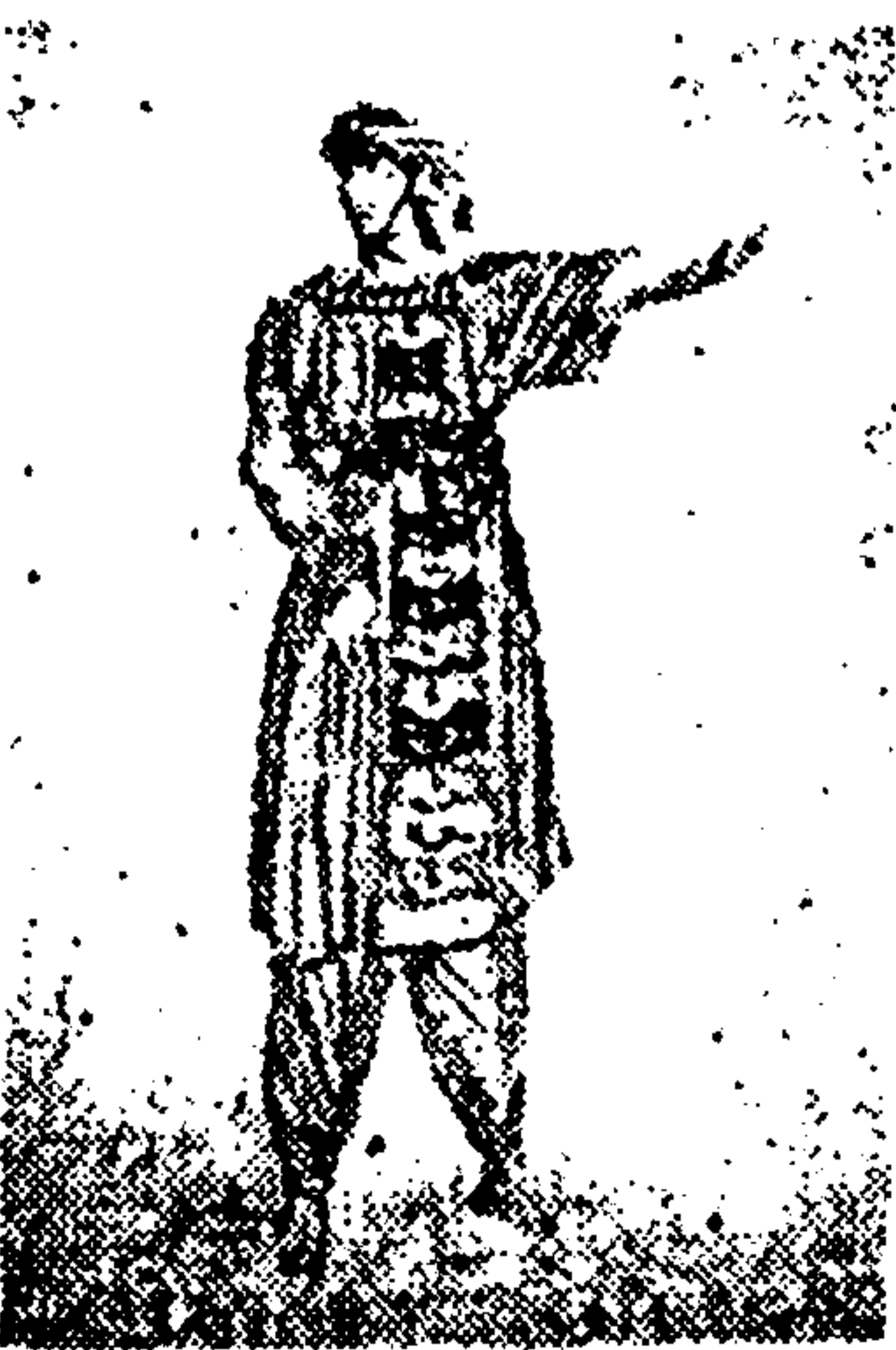
Figurín, de López Vázquez, para la obra de Rabindranath Tagore; titulada "El cartero del Rey"

La gentil Laura Pinillos, deliciosa actriz cómica, se presentará el próximo sábado en el teatro de la Zarzuela, como primera actriz de la compañía que dirigirá Antonio Murillo. La obra elegida para presentación será «Es mi hombre», de Arniches.