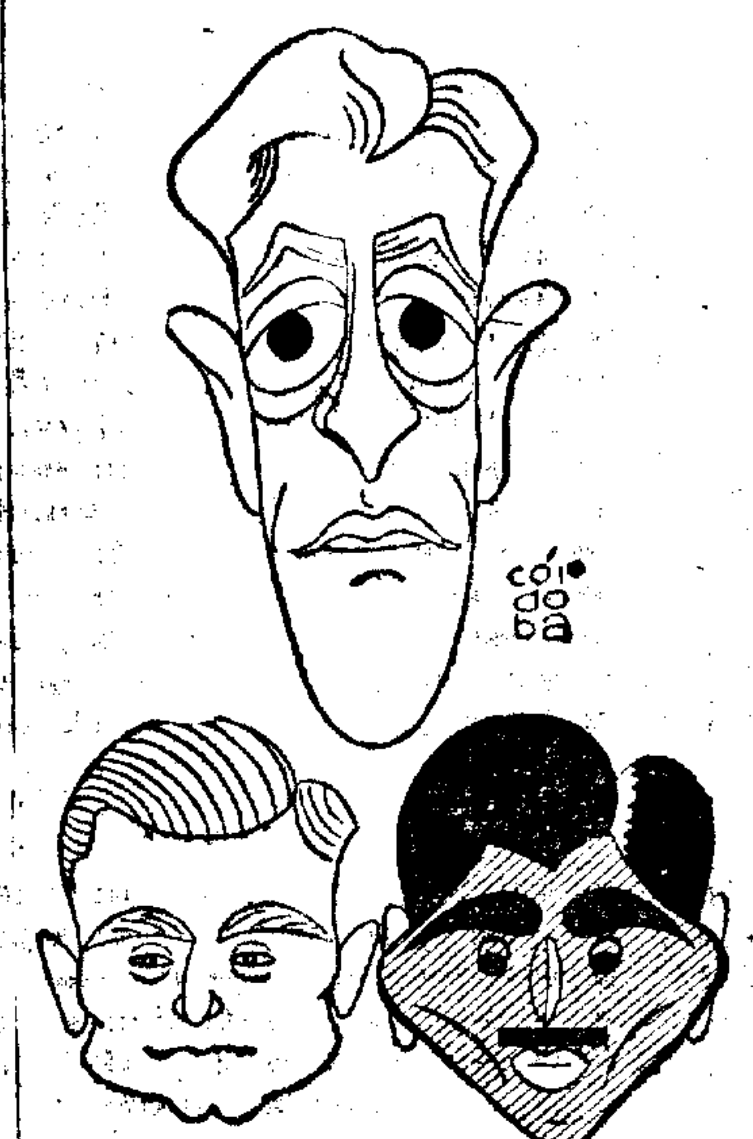
ZORI, SANTOS Y CODESO

La alegría, la risa, la carcajada, la diversión durante dos horas sólo las puede usted encontrar en el teatro de la Latina, viendo la gran revista "Tres gotas nada más", que es la revista del éxito constante.