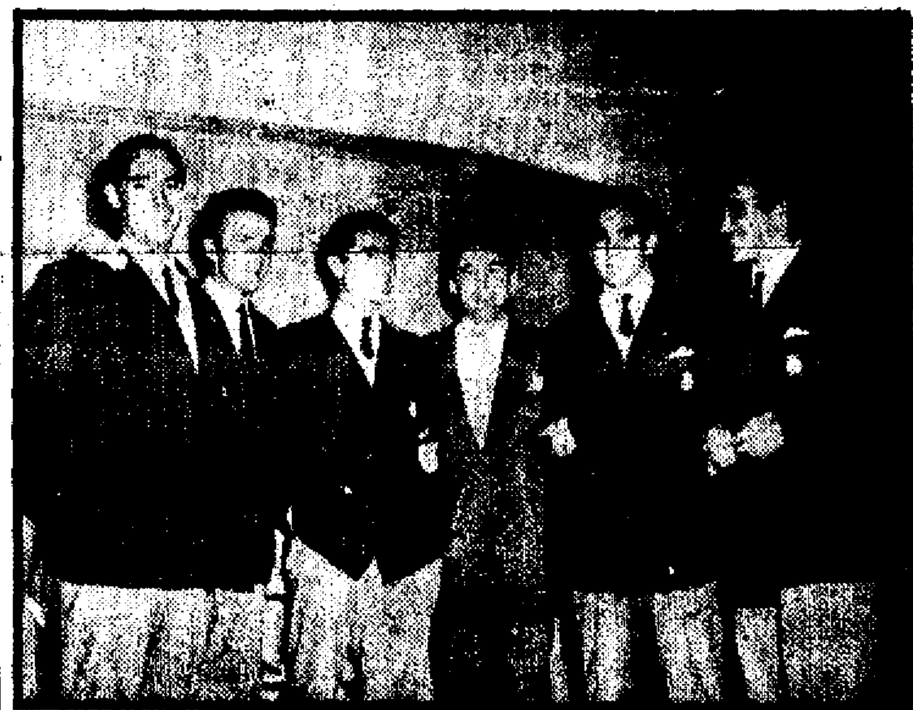
Pedro Terol, el gran cantante español, con los jugadores Panizo, Basora, Guinza, Zorra y Elizaguirre, que fueron a escucharle cantar en la Radio Bandeirantes la noche del día del encuentro entre España y Uruguay. Terol dedicó la audición a todos los jugadores españoles

acompañada a la guitarra por Eugenio González