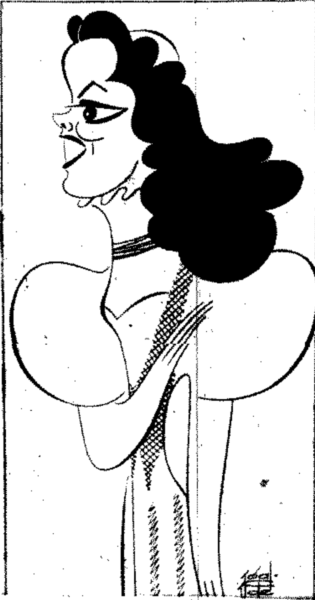
Aurora Bautista, vista por Ugalde