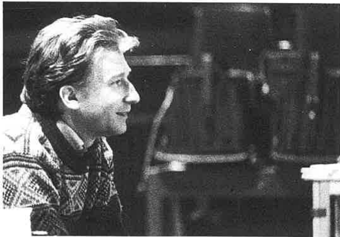
Albert Boadella dirigiendo un ensayo de Operació Ubú en 1981.