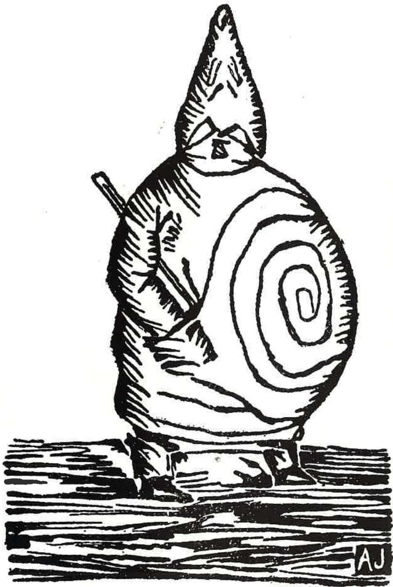
Bocetos de Alfred Jarry del personaje de Ubú.