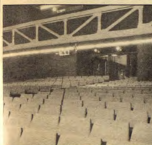
Una panorámica del patio de butacas