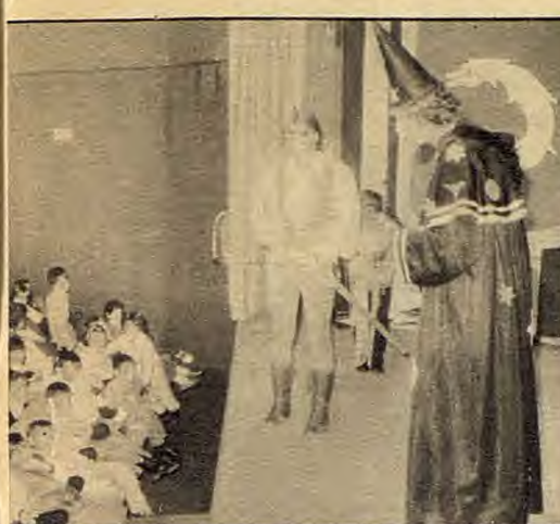
Representación infantil en el Espronceda