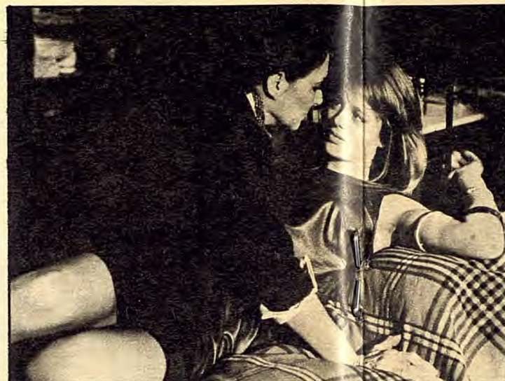
Emma Suárez y José Sancho en «La Chunga»