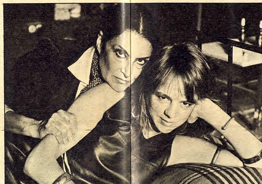
Nati Mistral y Emma Suárez en «La Chunga»