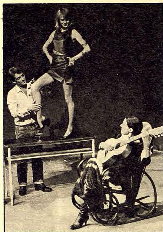
José Sancho, Emma Suárez y Nati Mistral en «La Chunga»