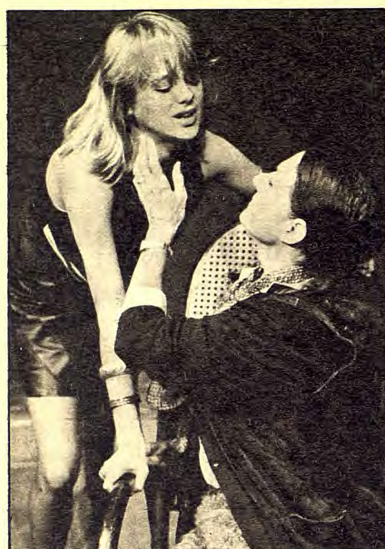
Emma Suárez y Nati Mistral en «La Chunga»