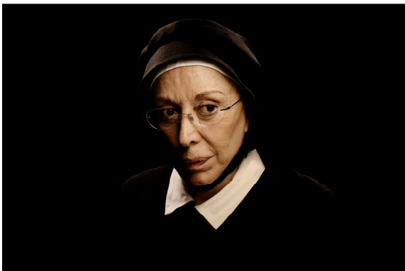
Rosa Maria Sardà / Germana Aloysiu