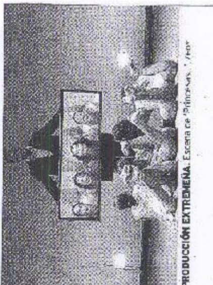
PRODUCCIÓN EXTREMENA. Escena de 'Princesas....'

día 8 de marzo en el Teatro Jovelana, con gran éxito de crítica y público. Según actores de la compañía, hay contratos avanzados para una actuación en las próximas temporadas y "posiblemente de repertorio y posiblemente Italia en 2016. La obra de Izhar Pascal y Cécilia D'Sa se podrá ver en Alcañal (13 de marzo), Barz de la Vera (14 de abril) y Talavera (19 de abril)