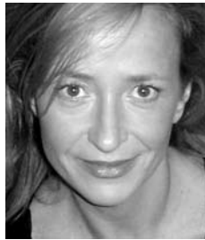
ANA GARAY ESCENOGRAFÍA Y FIGURINES