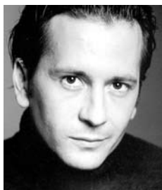
RAFA CASTEJÓN ACTOR CANTANTE GORÓN