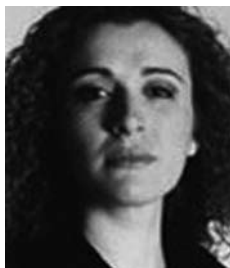
AMPARO NAVARRO SOPRANO AMAPOLA