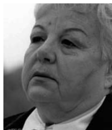
PEPA ROSADO ACTRIZ ULITA