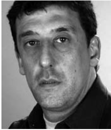
EDUARDO BRAVO ILUMINACIÓN (A.A.I.)