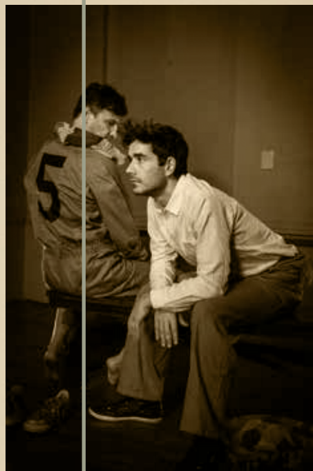
E L T R I N C H E

Un joven periodista se acerca al Trinche para armar su partido homenaje. Pero una vez ahí, junto a él, descubre que detrás de la leyenda del deporte se encuentra un hombre que tiene mucho más para decir que unas palabras de despedida. Juntos emprenden un viaje por los recuerdos, las anécdotas, los mitos y leyendas que envuelven al hombre.