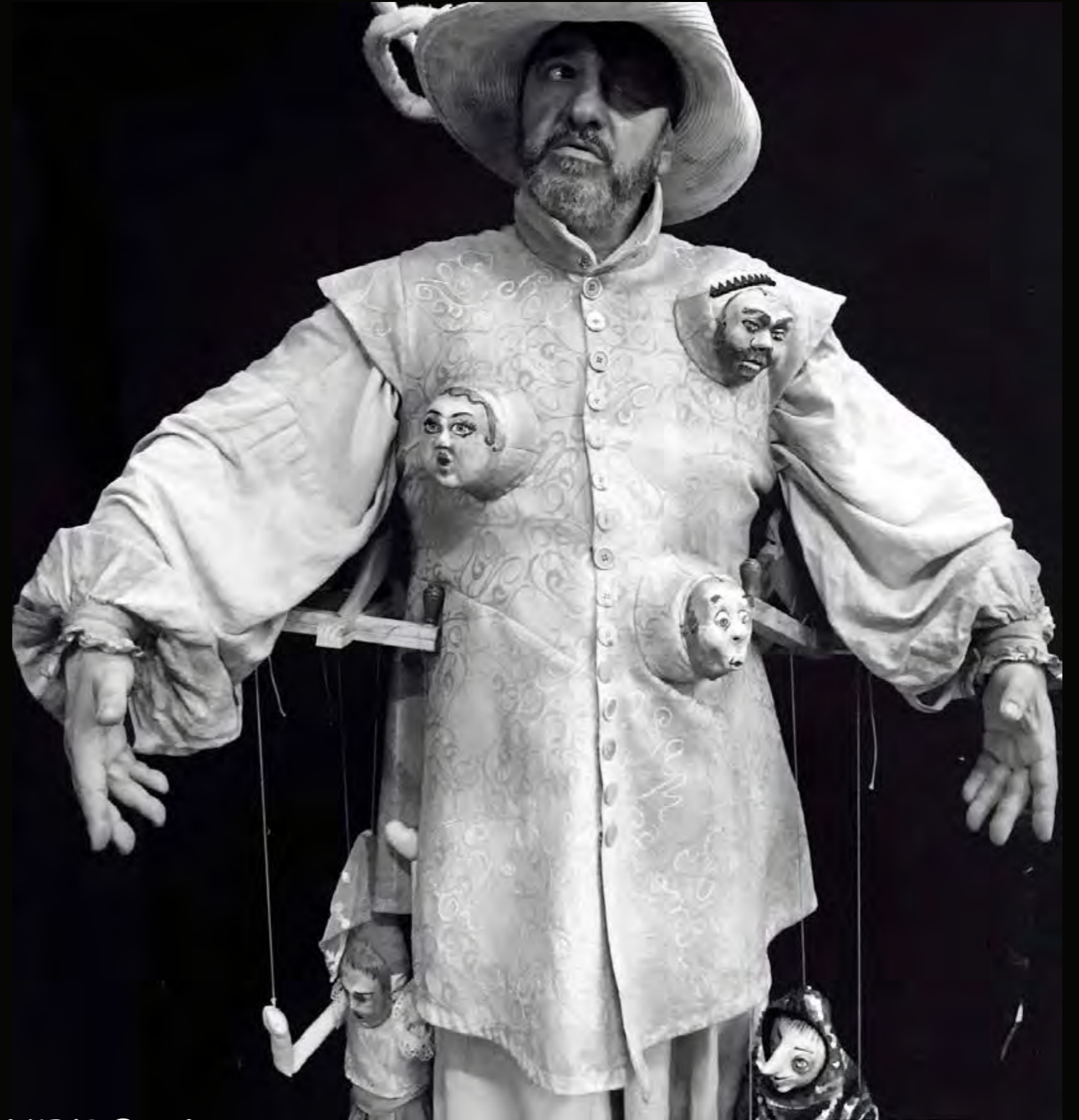
MAESE PEDRO, el titiritero personaje de El Quijote de Cervantes