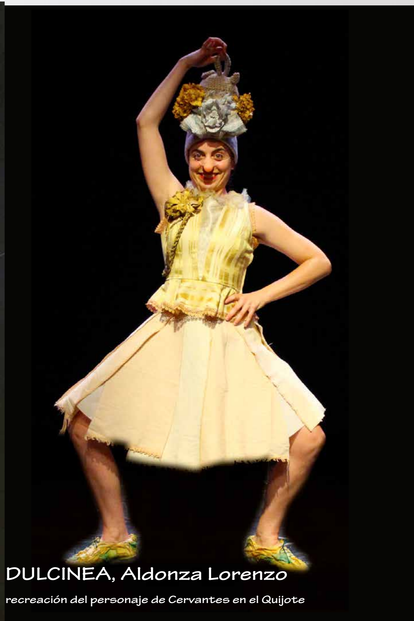
DULCINEA, Aldonza Lorenzo

recreación del personaje de Cervantes en el Quijote