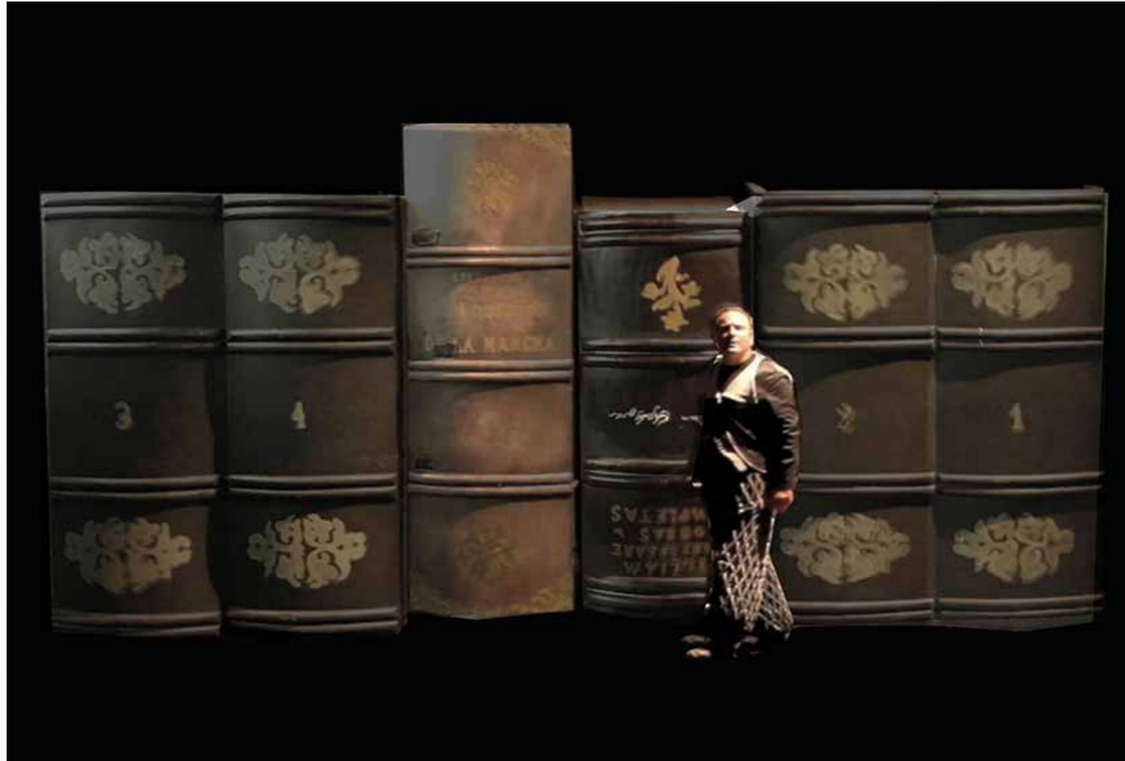
Un espacio mágico