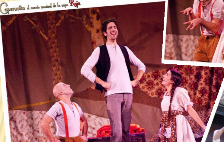
Caperucita el cuento musical de la casa Roja