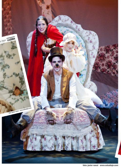
Caperucita el cuento musical de la casa Roja