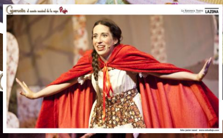
La Ratonera Teatro LAZONA